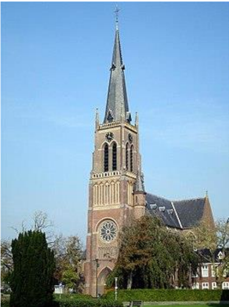
RK kerk Sint Nicolaasga Friesland

Esmee ruikt haar kans. De kerk is een indrukwekkend gebouw. Enorm. Ze is er nog nooit in geweest. Haar ouders zijn niet zo van de kerk. Maar Esmee is wel nieuwsgierig. Ook Siem wil die kerk wel eens van binnen zien.