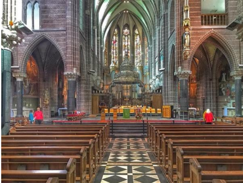
interieur Dominicanenkerk Zwolle