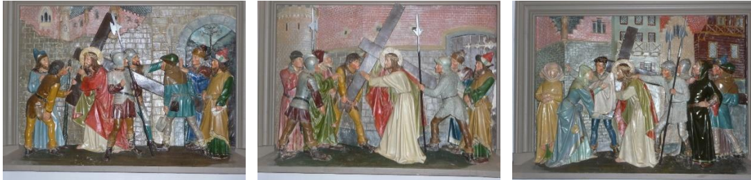
Kruiswegstaties uit de kerk van Warmenhuizen